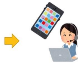
インターネットか電話で、区役所のマイナンバーカード（個人番号カード）交付窓口を予約して…