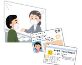
予約した日時に、マイナンバーカード（個人番号カード）を受け取ります。