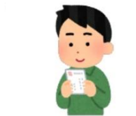
交付通知書が届いたら…